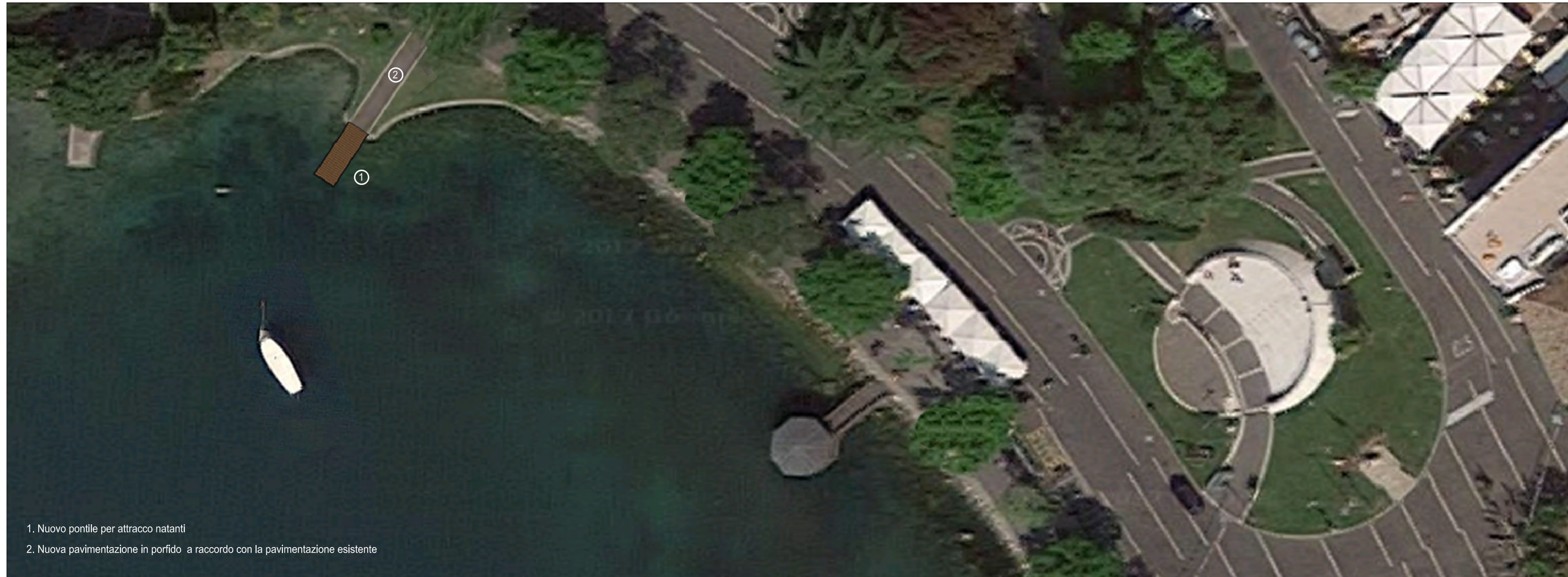
1. Nuovo pontile per attracco natanti 2. Nuova pavimentazione in porfido a raccordo con la pavimentazione esistente